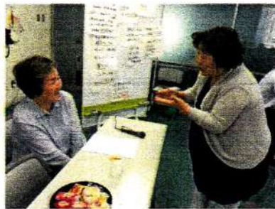
地域活動の先輩に積極的に質問！