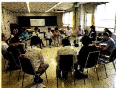
講座を共にする仲間と輪になって学び合い